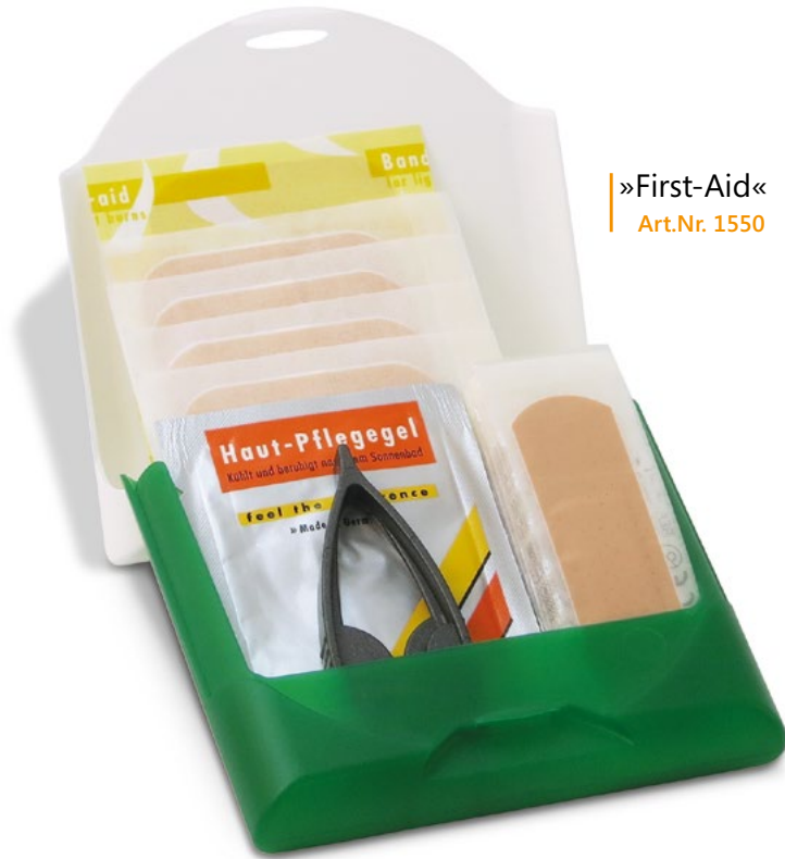
»First-Aid« Art.Nr. 1550