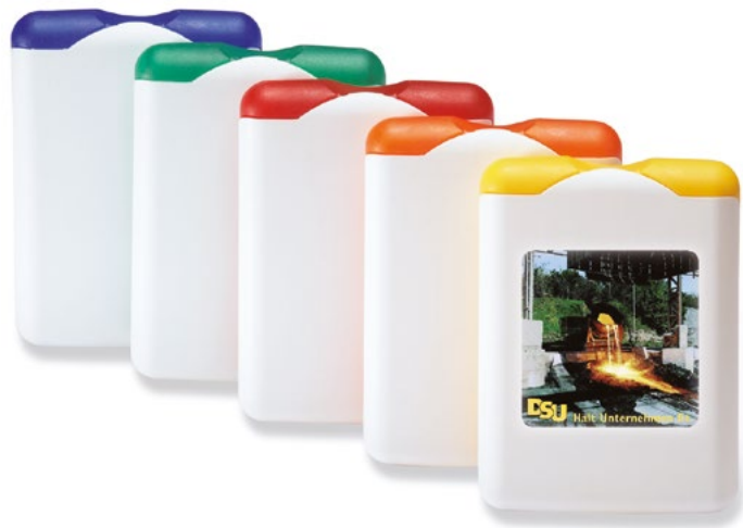
»First-Aid« Art.Nr. 1651