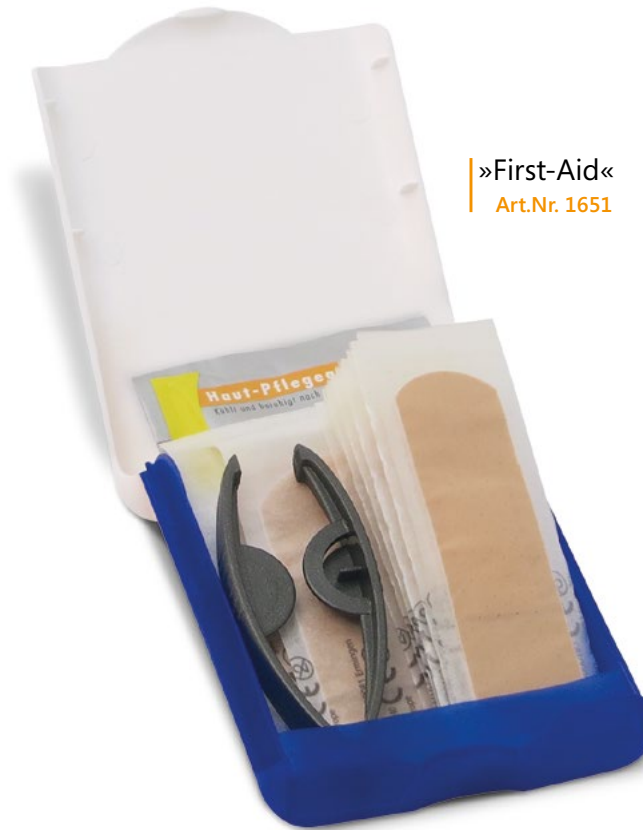
»First-Aid« Art.Nr. 1651