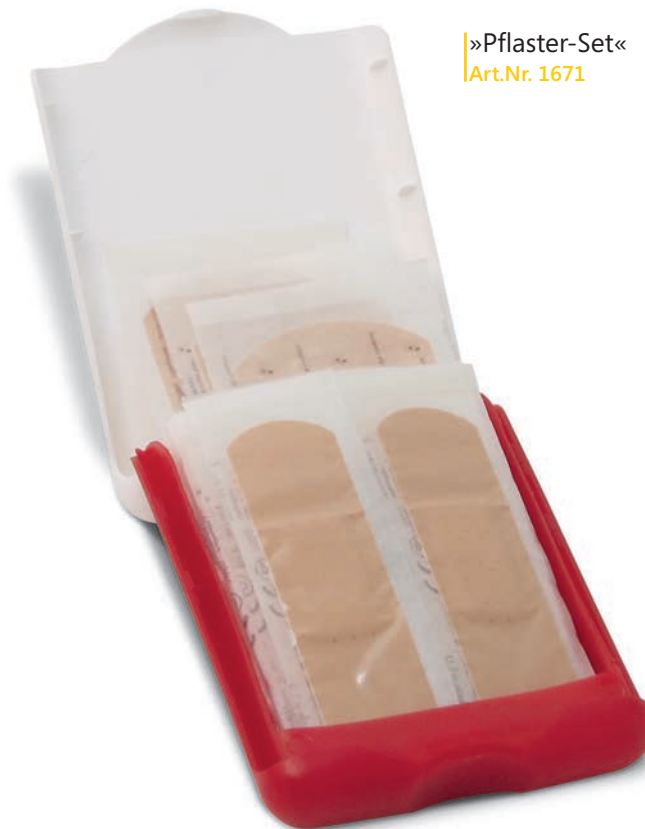
»Pflaster-Set« Art.Nr. 1671