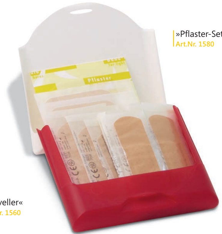
»Pflaster-Set« Art.Nr. 1580