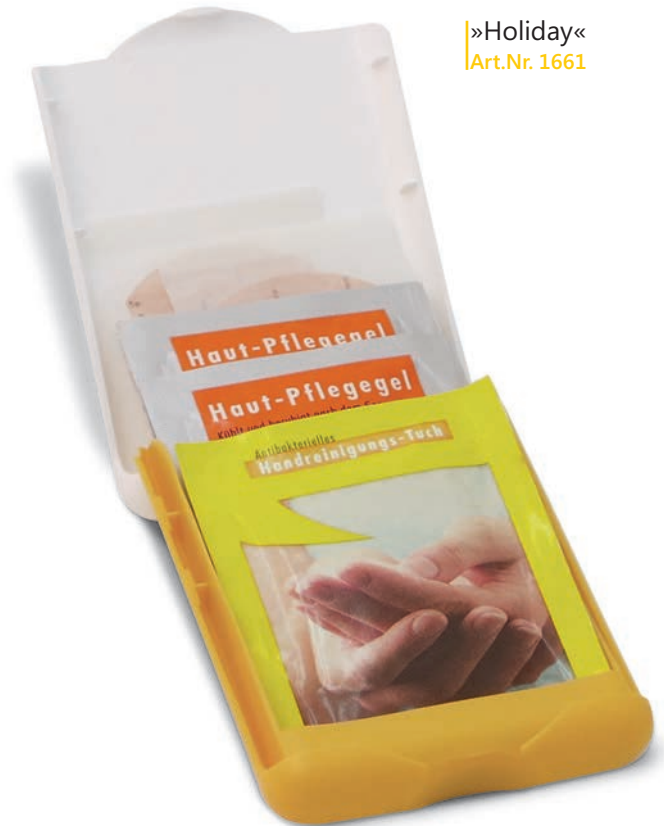
»Holiday« Art.Nr. 1661