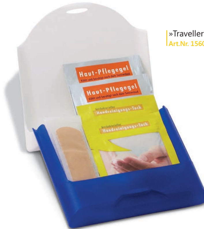
»Traveller« Art.Nr. 1560